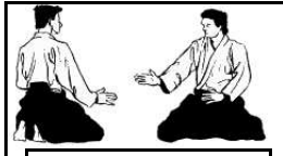
Suwari Waza à genoux