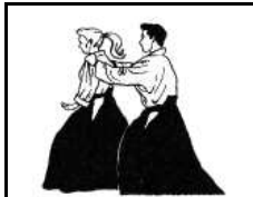
Ushiro Ryo Kata Dori saisie arrière des 2 épaules