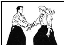
Katate ryote dori