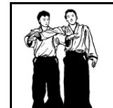
Ude Kime Nage